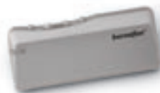
Дистанционное управление RC-P